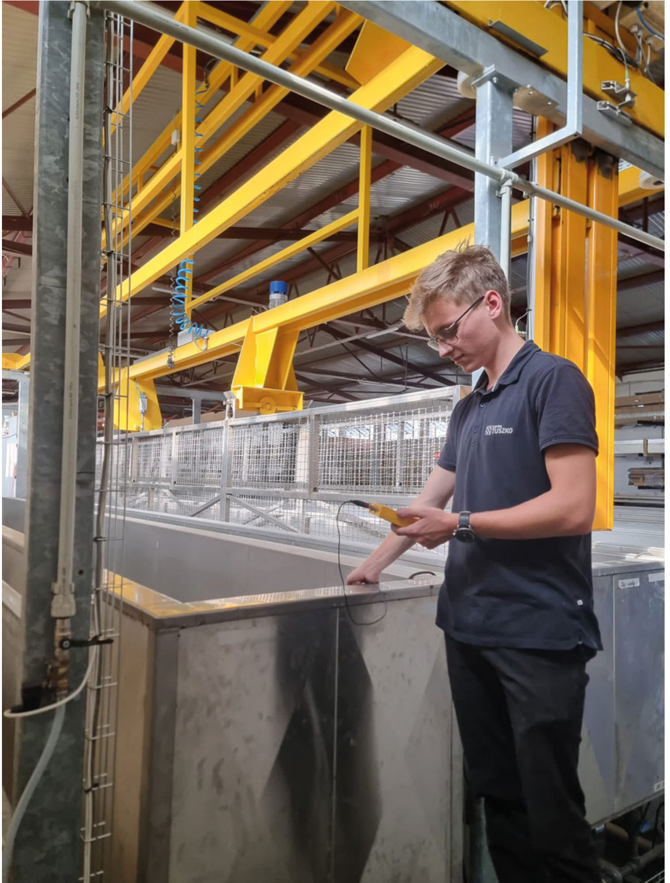
Перевірка параметрів ванни