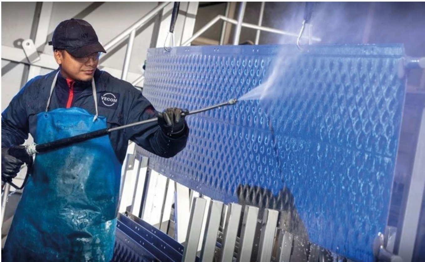
Фото.1. Підготовка поверхні за допомогою промивання під тиском