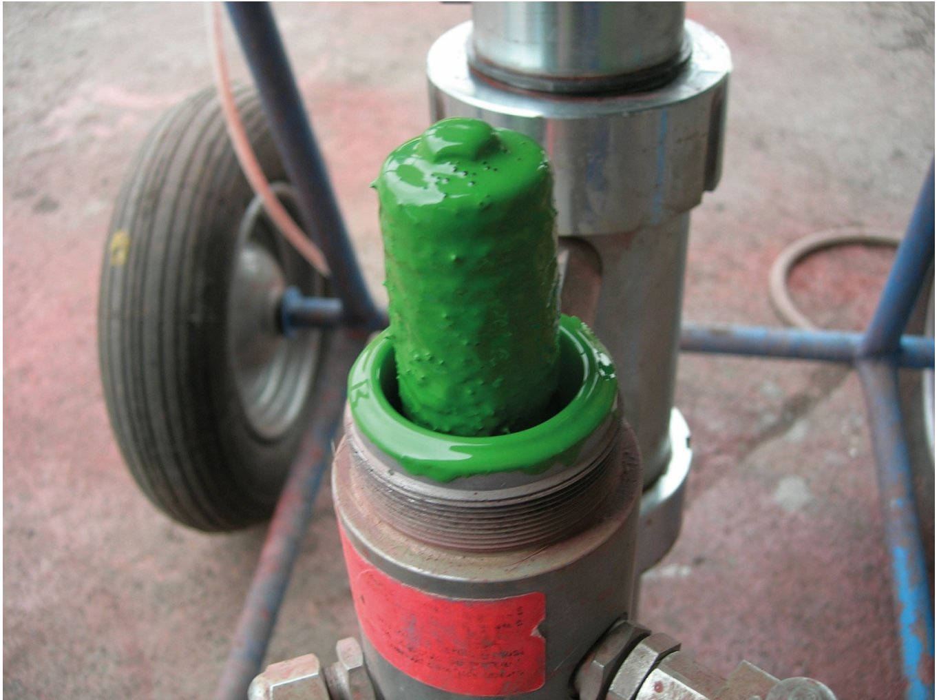
Фото.5. Цей фільтр не виглядає так погано, як в описаному випадку, але теж вимагає очищення.

Після очищення виявилось, що він пошкоджений. Вже не пам'ятаю, де мені вдалося за відносно короткий час отримати новий фільтр. Після заміни фарбування пройшло майже ідеально. Тепер проблема виникла, коли в установку повторно залили фарбу, яка використовувалася досі. Вона мала занадто низьку в'язкість для такого потужного насоса, і щоб правильно фарбувати цією фарбою зі справними незабитими фільтрами, необхідно було змінити сопло з 0,011" на 0,009" або навіть 0,007", а фільтри на набагато щільніші, ніж ті, що використовувалися досі. Моя подруга була дуже незадоволена проведеними випробуваннями, я думаю, вона була трохи ображена, що вони виявили недбалість у фарбувальному цеху, принаймні щодо знань і догляду за обладнанням, і подумала, що я порушив існуючий процес фарбування, який роками йшов без особливих проблем.