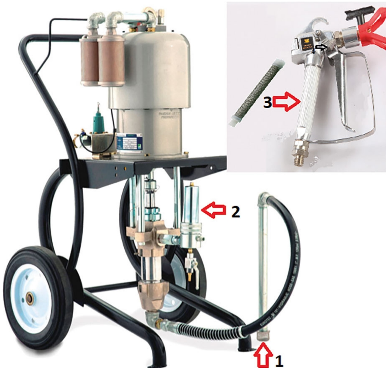
Фото.4. Розташування фільтрів в більшості установок для безповітряного фарбування.

Я показав присутнім, де знаходиться другий фільтр, і сказав відкрутити його. Мені зайняло досить багато часу переконати їх у цьому, але нарешті це вдалося. Фільтр був настільки забитий (фото. 5), що його довго знімали і чистили.