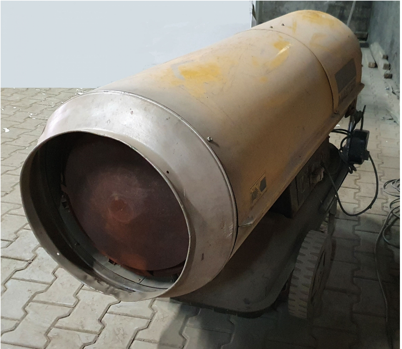
Фото.3. Такий обігрівач в жодному разі не можна використовувати для обігріву фарбувальної дільниці.

Я запитав одного з працівників, для чого вони використовують цей обігрівач, і дізнався, що коли стає холодніше, вони обігрівають ним фарбувальний цех, щоб забезпечити належні умови.